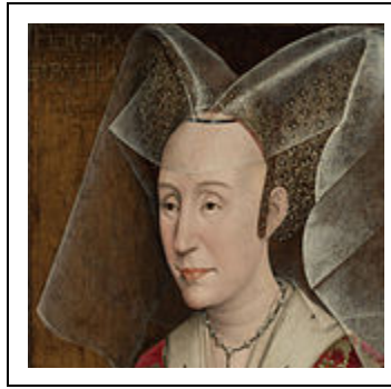
Van der Weyden (réplica?) (meia idade)