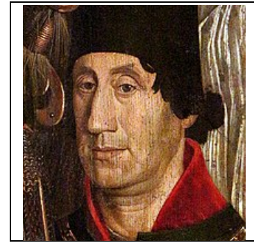
Infante D. Pedro (?) Painéis de Nuno Gonçalves

16. “Mudar moeda” significa desvalorizar a moeda. Esta operação financeira era positiva para o tesouro real mas muito negativa para a população, pois traduzia-se num aumento geral e descontrolado dos preços – «dano de todo o vosso reino», como afirma D. Pedro.